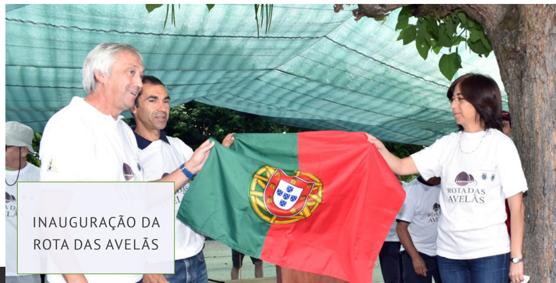
INAUGURAÇÃO DA ROTA DAS AVELÃS