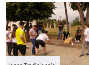
Jogos Tradicionais com Forte Adesão da População