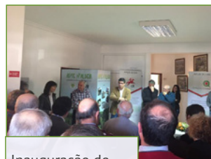
Inauguração do Espaço Cidadão na Freguesia